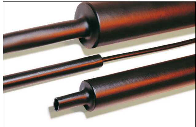
Medium tykkvegget krympeslange med eller uten lim.

Kuttete lengder kan leveres på forespørsel. Kontakt oss!